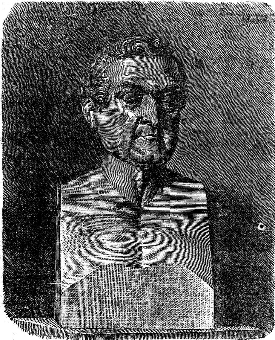
Κάρολος Ὀδεφρέδος Μύλλερως.

Τοῦ περικλεοῦς τούτου ἀρχαιολόγου, οὗτινος τὴν εἰκόνα δημοσιεύομεν ἐτελέσθησαν τῇ 16 Ἰουλίου παρελθόντος ἔτους τὰ ἀποκαλυπτήρια τοῦ ἐν τῷ Νέῳ Μουσείῳ τοῦ Βερολίνου στηθέντος ἀνδριάντος εἰς μνή-